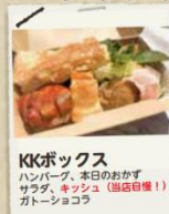
KKボックス ハンバーグ、本日のおかず サラダ、キッシュ (当店自慢！) ガトーショコラ