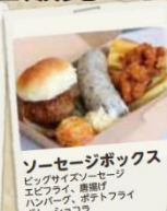
ソーセージボックス ビッグサイズソーセージ エビサラダ、美濃汁 ハンバーグ、ポテトフライ ガトーショコラ