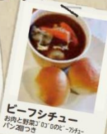
ビーフシチュー お肉と野菜の旨味のビーフシチュー パン2個つき