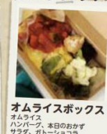
オムライスボックス オムライス ハンバーグ、本日のおかず サラダ、ガトーショコラ